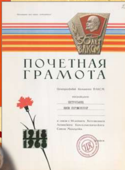
ЦДНИРО. Ф.Р - 3716. Оп.1.Д.19.Л.2.