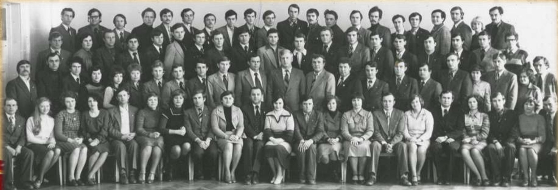
Первые секретари горкомов, райкомов ВЛКСМ. Секретари комитетов ВЛКСМ с правдами райкомов. Ростов-Дон апрель 1979г.

Первые секретари горкомов, райкомов ВЛКСМ Ростовской области.