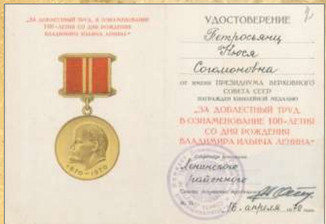
ЦДНИРО. Ф.Р - 3716.Оп.1.Д.18.Л.2.