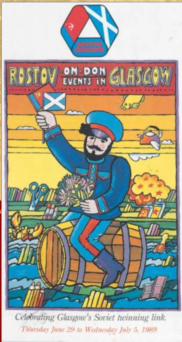
Обложка программы «Дни Ростова-на-Дону в Глазго». 1989 год. ЦДНИРО.Ф.Р-3716.Оп.1.Д.97.Л.1.