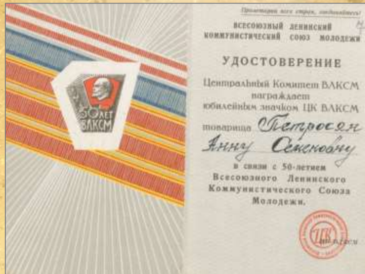
ЦДНИРО. Ф.Р - 3716.Оп.1.Д.18.Л.7.