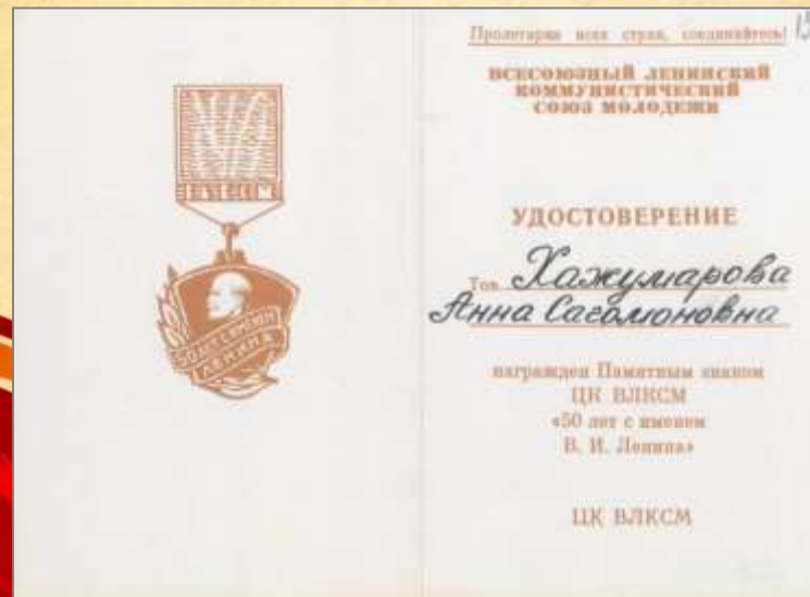
ЦДНИРО. Ф.Р - 3716.Оп.1.Д.18.Л.15.