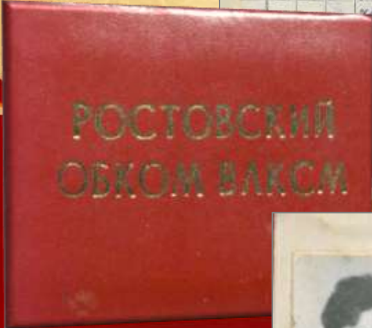
ЦДНИРО. Ф.Р - 3716.Оп.1.Д.4.Л.1-3.