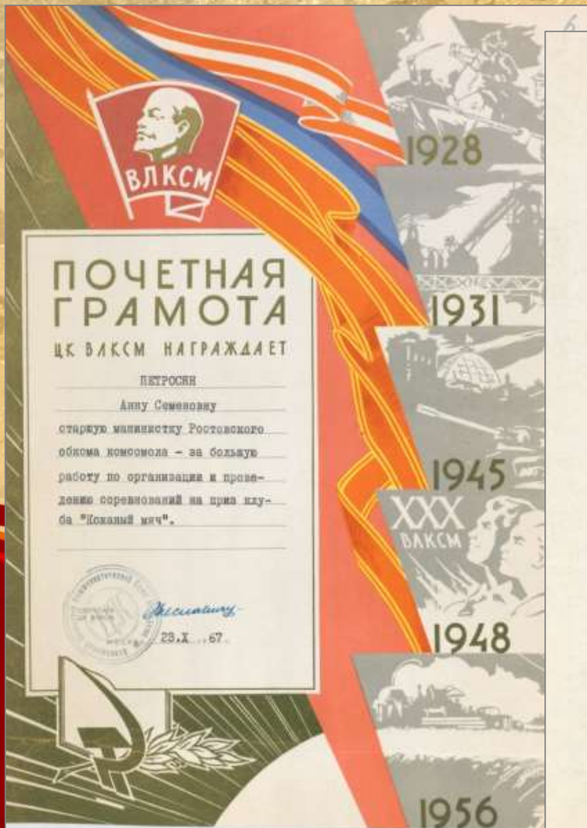
ЦДНИРО. Ф.Р - 3716.Оп.1.Д.19.Л.6.