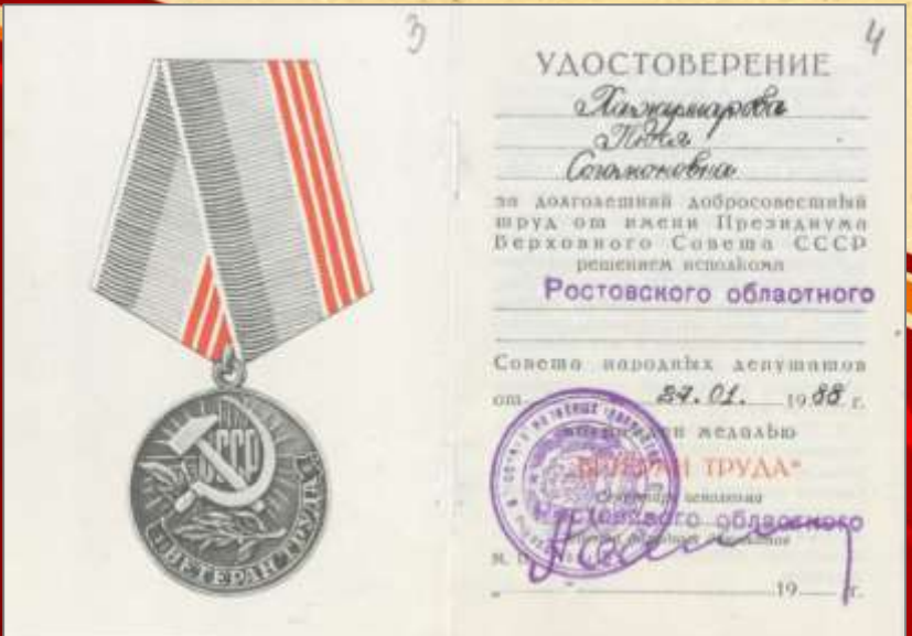
ЦДНИРО. Ф.Р - 3716.Оп.1.Д.18.Л.3-4.