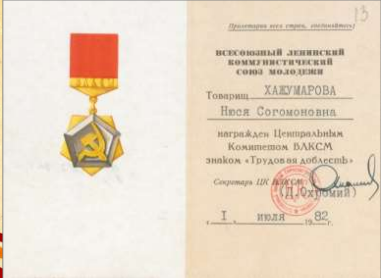
ЦДНИРО. Ф.Р - 3716.Оп.1.Д.18.Л.13.